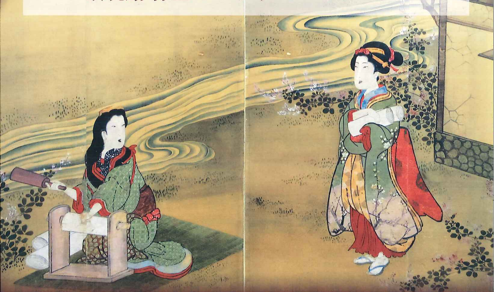
浮世絵屏風「砧」(部分) / 江戸後期